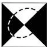
Associação de Xadrez do Distrito de Coimbra