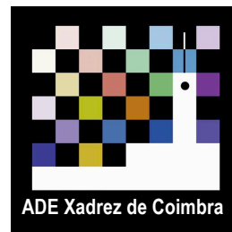
ADE Xadrez de Coimbra